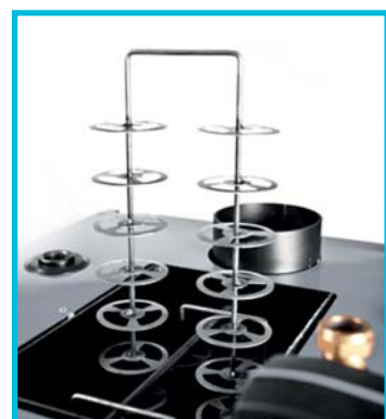
Automatyczne czyszczenie wymiennika kotła (turbulator spalin)

Problem czyszczenia osadzającej się sadzy, jak i usuwania popiołu w kotłach stałopalnych, rozwiązany został poprzez zastosowanie w kotle PELLUX 200 Touch systemu automatycznego czyszczenia rusztu palnika oraz kanałów spalinowych, co pozwala zaoszczędzić czas zapewniając jednocześnie optymalną pracę urządzenia i ekonomikę użytkownika. Taki system włącza się automatycznie przed każdorazowym rozpaleniem pelletu.